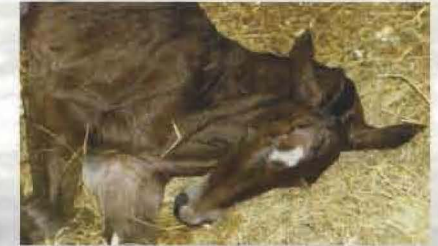
Unser Fohlen Grille 5 Min. nach Geburt

Auf unserem Hof haben wir neben unseren Oldenburger und Hannoveraner Warmblütern einen Rheinisch-Deutschen Kaltblüter, Rinder, Schafe, Hühner, Enten, Gänse, Katzen, Bienen und auch ein Pony.