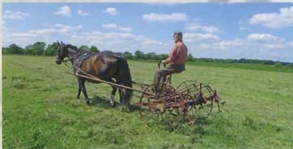
Stute Fiesta beim Heu wenden

Uns ist wichtig, dass die Vielfältigkeit sowohl in der Pflanzenwelt als auch in der Tierwelt erhalten und erhöht wird. Darauf ist unsere gesamte Bewirtschaftung der Flächen ausgerichtet. Zudem bauen wir einen großen Teil der Kulturen nur aus alten Sorten an.